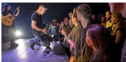
Begeisterte Besucher aus vielen Generationen verzeichnen Angebote wie das Tollhaus-Zeltival.