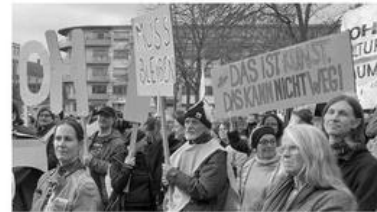
Auch für den Erhalt der Förderung für das Sandkorn-Theater wurde auf der Kundgebung demonstriert.