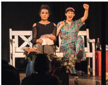
„Whiskey & Sugar“

Um dunkle Geheimnisse, die nach und nach ans Licht kommen, geht es im spannenden Theater-Thriller „Der Anruf“, der an zwei Terminen „On Tour“ in der Pfalz zu sehen ist: Am Samstag, 24. Mai, und am Sonntag, 25. Mai, ist „Der Anruf“ im Universum Theater Landau zu Gast. Ab 18. Juli ist das Stück rund um eine Callcenter-Mitarbeiterin, die nachts einen mysteriösen Anruf von ihrem Stalker annimmt, auch im Theater „Das Sandkorn“ zu sehen.