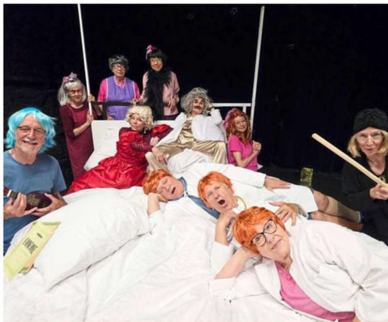
Körperlich, schrill und exzentrisch: Das Ensemble des Seniorentheaters Basta60+ probt die Komödie „Der eingebildete Kranke“ frei nach Molière.