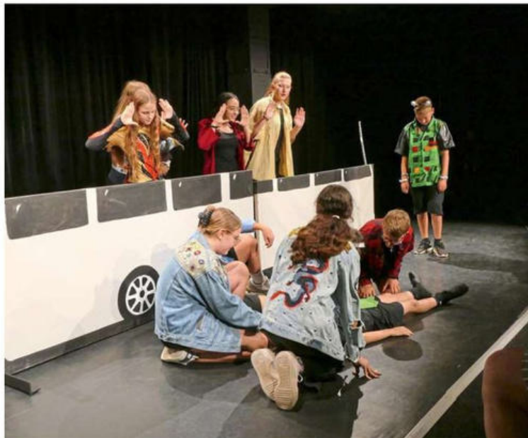
Auftakt mit Aliens und Superkräften: Mit „Rüdiger – der intergalaktische Teenager“ eröffnet die Anne-Frank-Schule die Schultheaterwoche.

Auch nicht viel besser ergeht es ab 19 Uhr der Jahrgangsstufe 1 des Gymnasiums Dornstetten, die sich in ihrer Eigenproduktion „Coming of Age – Das letzte Jahr vor dem echten Leben“ mit verschiedenen Aspekten des Erwachsenwerdens beschäftigt. Von der ersten Liebe bis hin zu Zweifeln und großen Sorgen. Sorgen bereitet am Sonntag ab 11 Uhr auch der 17-jährige Alan Strang dem Psychiater Martin Dysart. Um zu verstehen, wieso der Jugendliche sechs