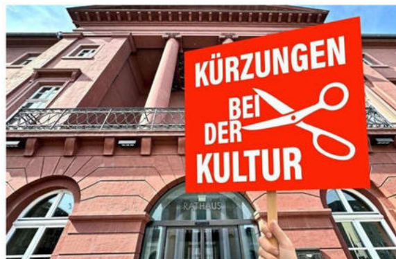
Um die Haushaltssperre aufzuheben, hat Karlsruhe auch bei der Kultur gekürzt. Und freie Träger fürchten, dass es im Herbst noch schlimmer kommt.

muss der Gemeinderat für die Jahre 2026 und 2027 jeweils 80 Millionen Euro kürzen oder umgekehrt Mehreinnahmen generieren, etwa durch das Drehen an der Steuerschraube. Nur dann ist absehbar ein genehmigungsfähiger Haushalt möglich. Alle Bürgermeister müssen in ihrer Zuständigkeit das entsprechende Poten-