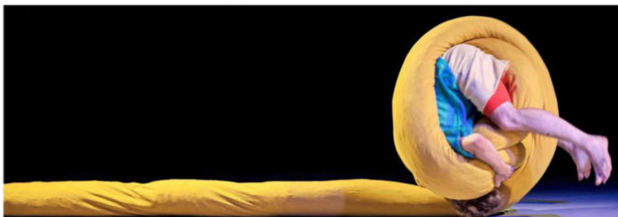
Die Kunstform Tanz wird im Kulturzentrum Tempel auch mit kindgerechten Aufführungen wie „Pasta ohne Ende“ präsentiert. Solche Angebote wären bei Kürzungen als erstes bedroht, sagen die Veranstalter.

lassen sich unmöglich kostendeckend organisieren. Würden wir den Eintritt entsprechend anpassen, wäre ein Großteil der Zielgruppe ausgeschlossen.“