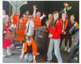
Das Humboldt-Gymnasium Karlsruhe zeigt am 3. Juli Ausschnitte aus dem Musical „Schockorange“, in dem ein Müllmann und ein Bankmanager den Job tauschen.