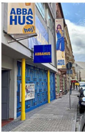
Blau-gelbe Fassade: das „Abba-Hus“ des Kammertheaters.