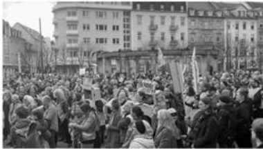
Die Kundgebung auf dem Karlsruher Stephansplatz gegen die geplanten Einsparungen in der freien Kulturszene.

Das riesige Sparpaket für die Jahre 2026 und 2027 ist schon seit Wochen Gesprächsthema in Karlsruhe. Es sind die härtesten Maßnahmen seit vielen Jahren, mit Einsparungen von mindestens 80 Millionen Euro pro Jahr. Besonders betroffen von der "Liste des Grauens" wäre die freie Kulturszene. Dazu zählen Kulturvereine, Filmfestivals oder freie Theater.