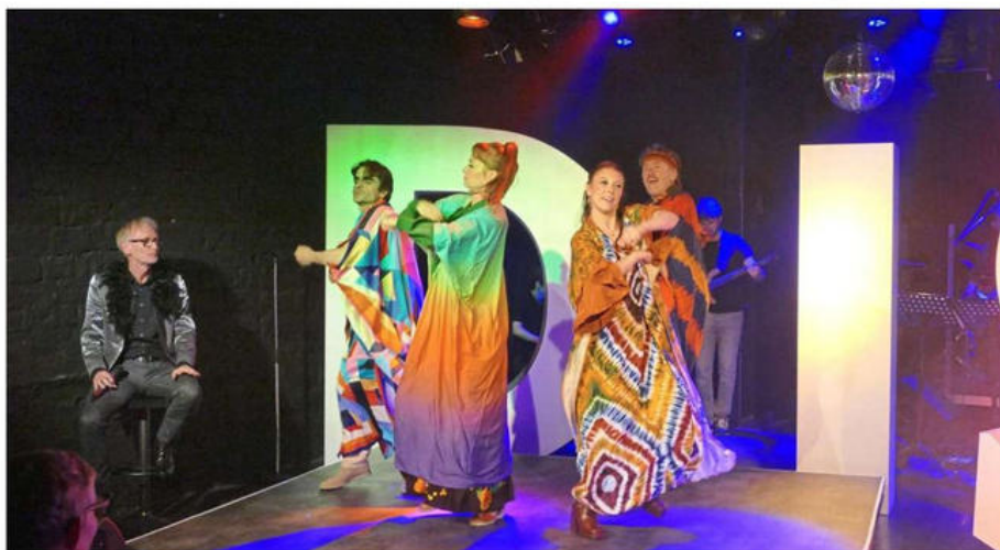
Das Ensemble des Sandkorn-Theaters zeigt sich beim Ausschnitt aus seinem Stück „Disco Queen. Im Fieber der 70er“ (Premiere im nächsten Monat) bestens aufgelegt – und macht mit Tanz, Musik und Schauspiel Lust auf mehr.

Draußen stehen bereits Mitarbeitende und rufen noch einmal die Aktion „#gehts noch Karlsruhe“ in Erinnerung, die über das Sterben der Kultur in der Stadt informiert. Was wird drinnen geboten? „Disco Queen. Im Fieber der 70er“