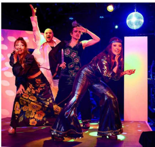
Die Disco-Ära der 70er Jahre beschwört das Sandkorn-Theater Karlsruhe mit dem Stück „Disco Queen“ und zahlreichen Hits jener Zeit.

Allerdings, räumt er ein, habe man auch gezielt über die Erfolgsaussichten nachgedacht. „Wir erleben gerade eine Kombination aus steigenden Kosten und sinkenden Zuschüssen“, sagt Rastetter. „Das macht die Spielräume für Experimente deutlich enger als früher.“ Ge-