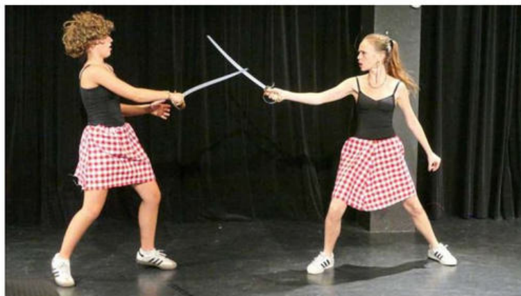
Die Theatergruppe des St. Dominikus setzt zum Abschluss der Schultheaterwoche mit „Shakespeares sämtliche Werke (leicht gekürzt)“ ein letztes Ausrufezeichen.

Bleibt zu hoffen, dass sich Karlsruhe diesen Nachwuchs nicht irgendwann wegwinkt.