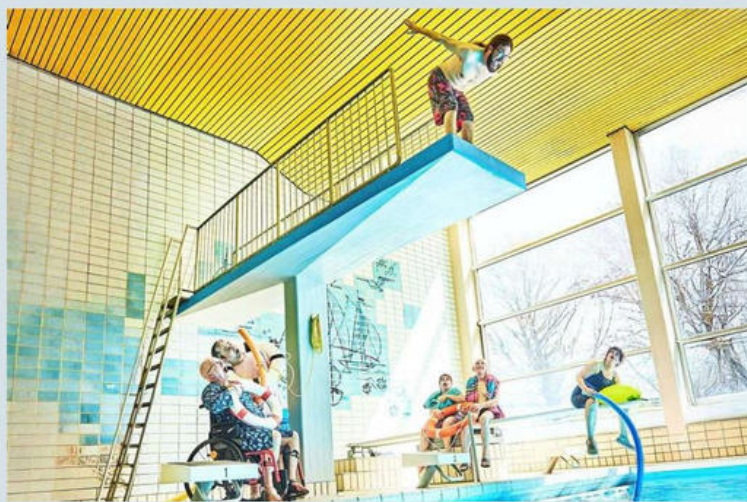
Mit ihrer „Angst & Mut Show“ werden DIE SPINNER! im SANDKORN das Publikum wieder begeistern.

Badische Woche, Kulturhighlights, 07.06.2025