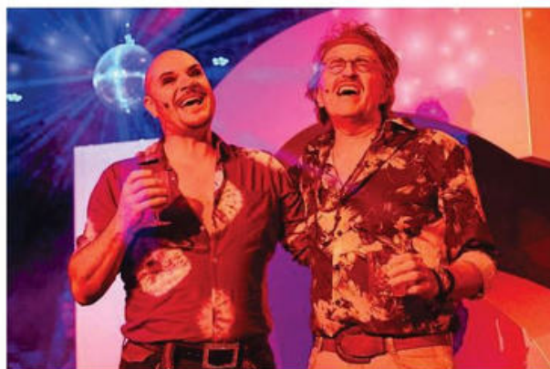
Das neue Musical „Disco Queen – Im Fieber der 70er“ mit Liveband begeistert mit Pop und Schlagern sowie komödiantischer Zeitgeschichte.

Apropos Geschenk: Ein Theatergutschein sorgt für leuchtende Augen und kann online über www.das-sandkorn.de oder im SANDKORN-Ticketbüro in der Kaiserstraße 11 erworben werden. pr