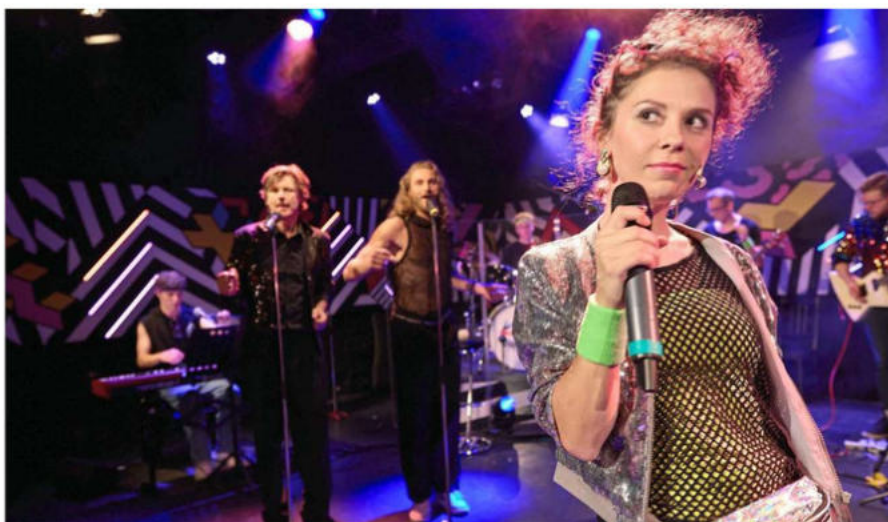
Trotz großem Publikumszuspruch sind Karlsruher Kultureinrichtungen wie das Sandkorn-Theater (Szenenfoto aus der Revue „Mit Vollgas in die 80er“) auf Zuschüsse angewiesen. Kommunale Sparpläne bereiten Kulturmachern daher Existenzängste.