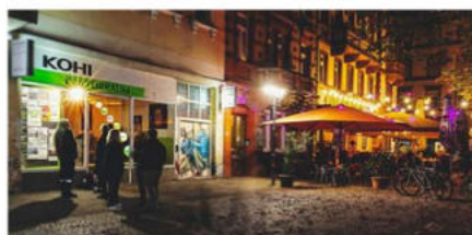
Das Kohi am Werderplatz könnte bei Zuschusskürzungen nicht auf dem bisherigen Niveau weitermachen.