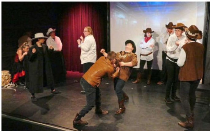
Mit seiner Inszenierung von „Der Schuh des Manitu“ bereitet das inklusive Theater „Includo!“ dem Publikum im Sandkorntheater Karlsruhe einen schönen Abend.

Beim Sandkorntheater und auch beim Exiltheater in Bruchsal (Aufführungen am 23. und 24. Mai) sei man dann auf offene Ohren gestoßen. Diese hätten mit der Aufführung ebenso wenig Probleme gehabt, wie das Publikum.