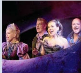
Mit dabei ist auch das Stück „In der Mitte ist ein Loch“.