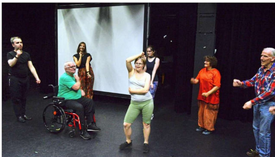
Und manchmal, da muss man die Angst einfach wegtanzen: Die inklusive Theatergruppe Die Spinner probt für die Angst & Mut Show. An dem Stück arbeiten die Schauspieler seit Januar.

Die Stücke der Spinner sind immer selbst entwickelt, die Ideen selbst gefunden, das Gespielte häufig genug der eigenen Biografie entnommen. Oft gelingt es den Spinners dadurch, eine Wucht in ihrem Spiel zu erzeugen, die manch traditioneller Aufführung fehlt. Längst hat die Truppe ihr eigenes Publikum herangezogen, das sich regelmäßig auf die drei Tage im Sommer freut, wenn die Spinner