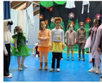
Ein Schaf entdeckt seine Stimme in dem musikalischen Stück „Ein Schaf sagt Mäh“, das die Johannes-Kepler-Grundschule Mannheim am 7. Juli aufführt.