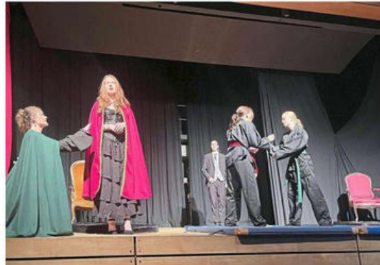
Ein Judokampf visualisiert den verbalen Schlagabtausch der Königinnen Maria Stuart von Schottland im grünen Cape und Elisabeth von England im roten Cape.

Ettlingen. Nicht eine, sondern gleich elfmal steht Elisabeth, Königin von England, stramm geschnürt in je eine schwarze Brokat-Corsage, wie sie in der Gothic-Szene beliebt ist, auf der Bühne der Aula des Eichendorff-Gymnasiums. Das ist nur einer der zahlreichen post-dramatischen Akzente, die Deutschlehrer und Theaterpädagoge Michael Polty bei der Bearbeitung von Friedrich Schillers 1801 vollendetem Trauerspiel „Maria Stuart“ setzt. Das Stück von der Theater AG für seine jüngste Inszenierung einstudiert, feierte am Samstagabend Premiere und ist auch bei den Schultheaterwochen im Sandkorn-Theater Karlsruhe vertreten. Niemand ist frei in seinem Handeln, nicht einmal die Königinnen von England und Schottland, jene „Schicksalschwester“ – die mindestens je einmal von jeder der SchülerInnen gespielt werden. Immer gibt es Einflüsterer, wie der opportunistische Lord Leicester (Elias Peter) oder der unerträgliche Lord Bur-