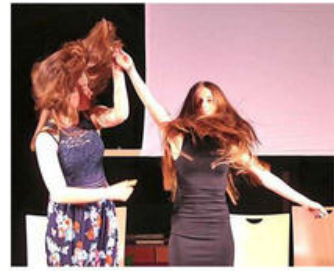
Fallen oder doch fliegen? In der Eigenproduktion „Coming of Age“ des Gymnasiums Dornstetten am 5. Juli dreht sich alles um verschiedene Aspekte des Erwachsenwerdens.